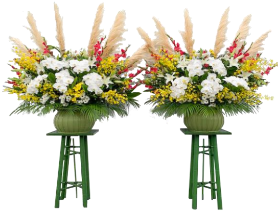
生花（超特大） 1 対 110,000 円