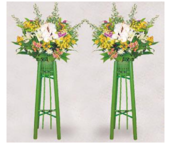
生花（大） 1 対 33,000 円