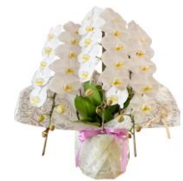
自宅後祭り用 胡蝶蘭 1 鉢 33,000 円