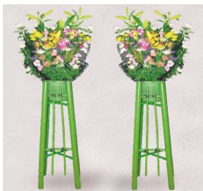
生花 1 対 22,000 円