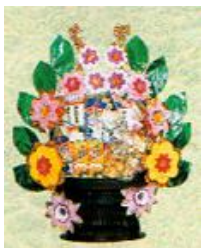
盛りかご各種 1 個 菓子 11,000 円 ジュース 11,000 円 果物 11,000 円 果物は期間限定商品 (11 月から 4 月まで)