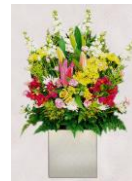
掛花 1 基 6,600 円