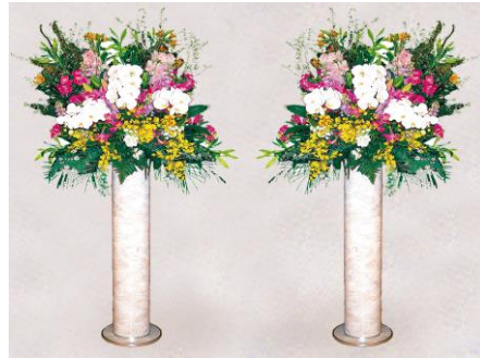
生花（特大） 1 対 55,000 円