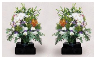
枕花 1 対 33,000 円