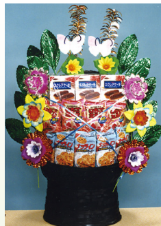
盛籠[菓子] 1籠 11,000円[税込]