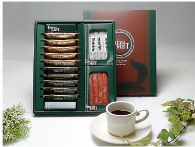
AGF コーヒーセット 1,080円 [税込]