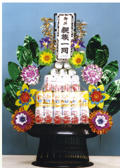
盛籠[ジュース] 1籠 11,000円[税込]