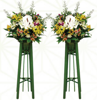
生花[大] 1対 33,000円[税込]