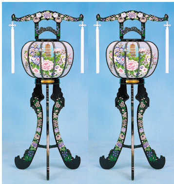
回転提灯[黒] 1対 16,500円[税込]