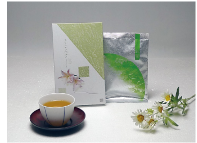
静岡産 煎茶 540円 [税込]