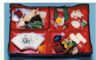
1人前 2,700円 [税込]