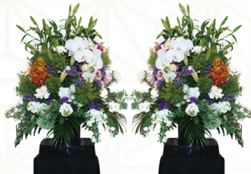
枕花 1対 33,000円[税込]