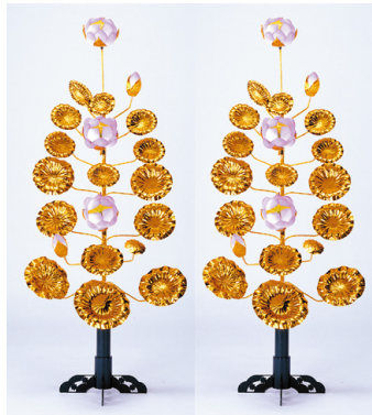
蓮華3灯[金・銀] 1対 16,500円[税込]