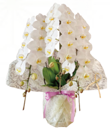
胡蝶蘭 1鉢 33,000円[税込]