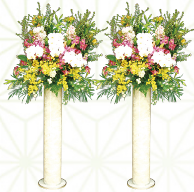
生花[特大] 1対 55,000円[税込]