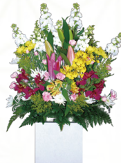
掛花 1基 6,600円[税込]