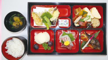
1人前 3,850円 [税込]