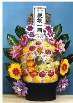
盛籠[果物] 1籠 11,000円[税込]