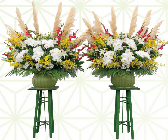
生花[超特大] 1対 110,000円[税込]