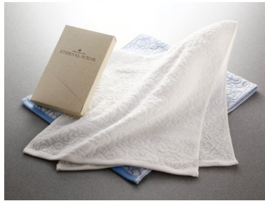
今治「ローズ」 フェイスタオル1P 770円 [税込]