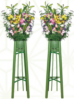
生花 1対 22,000円[税込]