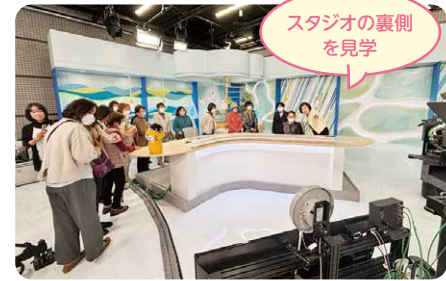
スタジオの裏側を見学