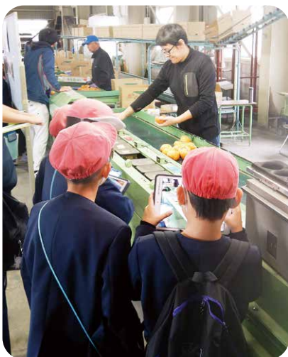
選果の様子をタブレットで撮影

担当したJ A職員は「生産者が一生懸命育てた柿が、どのような工程を経て消費者に届けられるのかを知ってもらおう良い機会。今津産のおいしい柿をぜひ食べてほしい」と話しました。