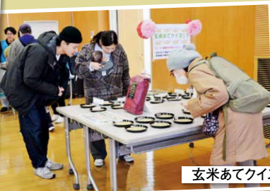
玄米あてクイズコーナー