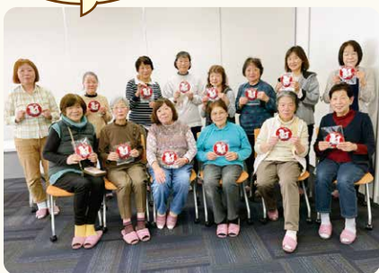
皆さん満足の出来栄でした!