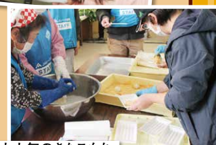
大人気のきなこもち