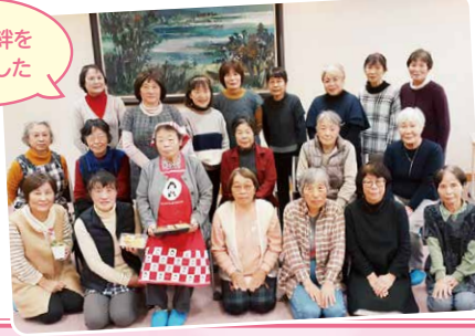
交流と絆を深めました