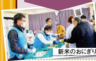
新米のおにぎりをどうぞ

恒例の甘酒や豚汁、「きらみずき」「みずかがみ」のおにぎりのふるまいは今年も大好評。その他、支店ふれあい委員会による焼き芋やスーパーボールすくい、女性部の販売コーナー、青壮年部「絆の会」による大型農機やドローン展示など盛りだくさんの内容で大盛況の2日間でした。