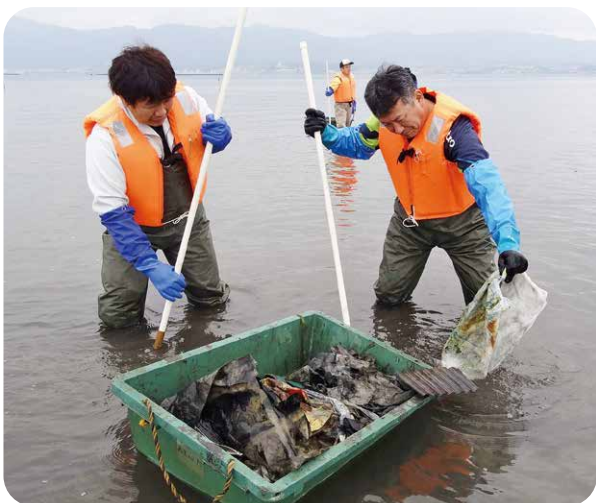
約300kgものゴミを引き上げました

活動に参加したJ A職員は「環境の美化を続けるとともに、天災で農業資材が琵琶湖へ流出しないよう巡回啓発にも力をいれたい」と話しました。