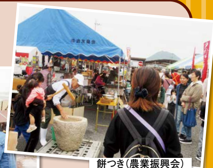
餅つき(農業振興会)