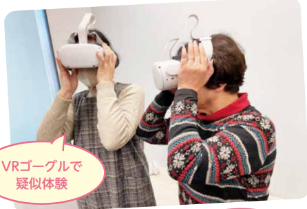
VRゴーグルで疑似体験

防災講習会では、NHK職員から災害発生時の対応について説明を受けた後、VRゴーグルを装着し災害現場を疑似的に体験しました。防災について学んだあとは、琵琶湖ホテルでランチタイム。支部間で交流を深めました。