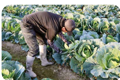
順調に生育した「近江のキャベツ」を収穫

「近江のキャベツ」は、同 J A湖南地域の草津、草津、栗東、守山野洲地区の行政、市場などの関係機関が立ち上げた「湖南地域野菜振興協議会」が水田を活用した野菜の栽培（水田裏作）を推進し、農業所得の向上に取り組んでいます。