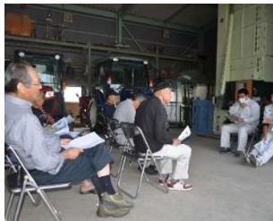
水稻集落巡回指導

農産物検査員の資格を持つ JA 職員が米の形質、成熟割合などを慎重に確認し、等級格付けを行っています。