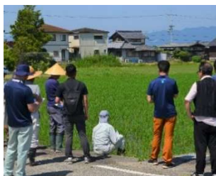
みずかがみ栽培現地研修会