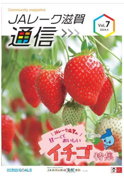
タブロイド誌 「JA レーク滋賀通信」