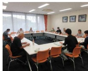
こんぜ清流米研究会研修会