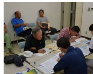
環境こだわり農産物生産記録記帳会