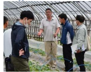
草津メロン定植後研修会