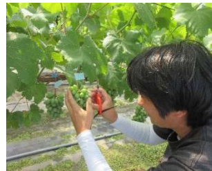
栗東市チャレンジ農業塾