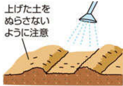
ジョウロでまき溝全面にたっぷり灌水する