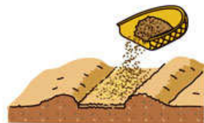
細かく砕いた完熟堆肥または切りわらで薄く覆っておく