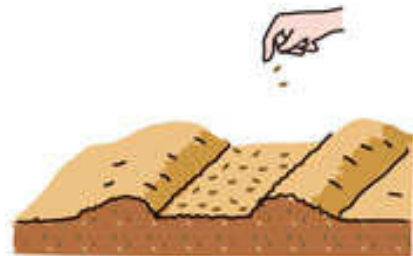
1cm間隔ほどで満遍なく種をまく